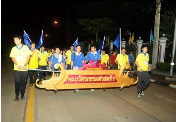
ภาพประเพณีเดิน-วิ่ง สักการะพระยาพิชัย-ไหว้สาพระแท่นศิลาอาสน์ 30 สิงหาคม 2557